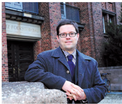
■ Lars Rohwer MdL auf dem TU-Dresden Campus

Rohwer ist selbst Familienvater und weiß, wie wichtig Bildung für die Zukunft eines Landes ist. Als der 38-jährige CDU-Politiker 2009 den Posten des finanzpolitischen Sprechers seiner