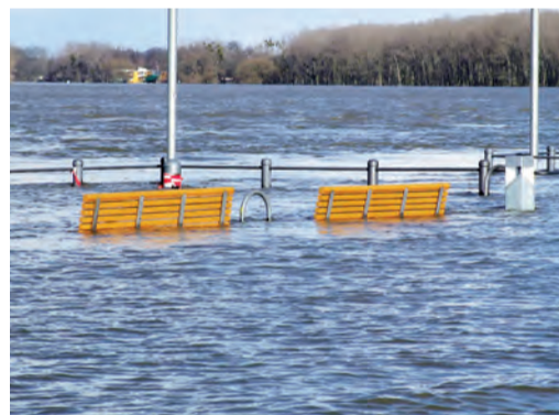
■ Sachsen: Milliarden für Hochwasserschutz

Sachsen wird immer wieder von Wassermassen durchflutet – so 2002 oder auch im vergangenen Jahr sogar zwei Mal. Die Schäden nach einem Hochwasser sind immer wieder verheerend. Doch der Freistaat arbeitet mit Hochdruck daran, sie zu beseitigen. Viel wurde schon gebaut, aber dennoch steht einiges an.