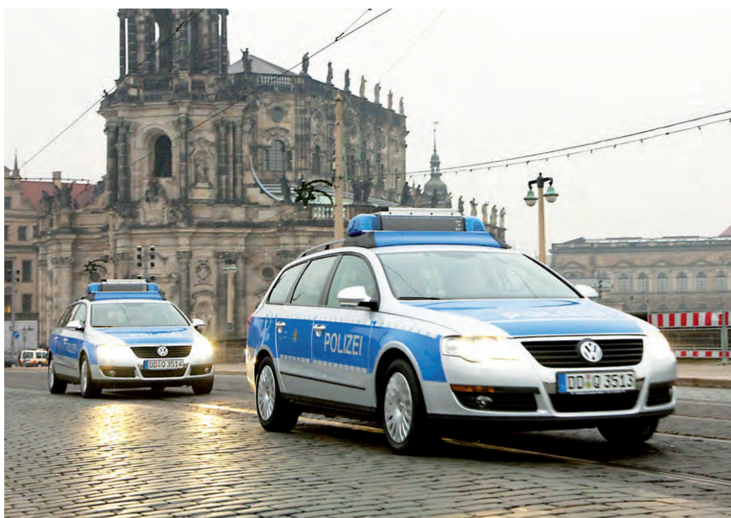
■ Sichtbare Sicherheit: Im Freistaat Sachsen ging die Zahl der Straftaten deutlich zurück

Die sächsische Polizei kann aber auch eine gestiegene Aufklärungsquote vorweisen. Sie lag im Jahr 2009 bei 56,9 Prozent; mehr als die Hälfte aller gemeldeten Straftaten konnte also aufgeklärt werden. Gleichzeitig registrierte die Polizei weniger Delikte: 279 467 waren es im vergangenen Jahr, 16 350 weniger als 2008. Damit fiel diese Zahl auf