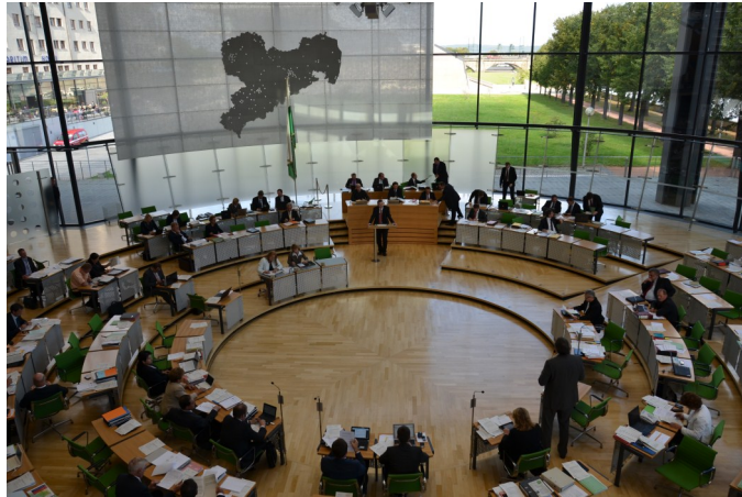
Auch bei der ersten Debatte der 40. Plenarsitzung des Sächsischen Landtages am 14. September ging es um Finanzen.

bereitgestellten 2,28 Milliarden Euro Solidarpaktmittel legten Land und Kommunen noch 840 Millio-nen Euro drauf und bauten damit